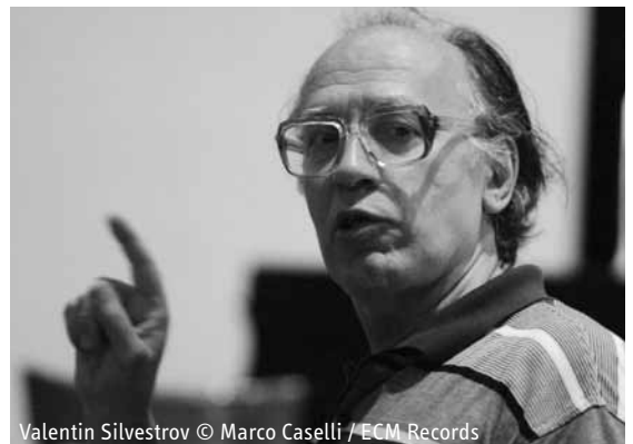
Valentin Silvestrov

De Amerikaans-joodse componist George Rochberg vocht voor de geallieerden in Normandië, raakte zwaar gewond, maar overleefde. Op Mannes College of Music kreeg hij onderwijs van de legendarische dirigent George Szell. Aan het Curtis Institute deed hij eerste ervaringen op als docent in de jaren 1948-1954. In 1950 werd hij gewonnen voor het serialisme door Luigi Dallapiccola tijdens een verblijf in Italië. Aan de zijde van de Italiaanse avant-gardist kreeg hij er het gevoel zich in de frontlinie van de nieuwe muziek te bevinden. De Franse componist